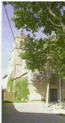
Text, fotos i mapa: JOAN PORTELL i RIFA Il·lustració: MONTSE FRANSOY

moll hi ha un aguait (5,85 km) que ens permet observar discretament les polles d'aigua, els martinets blancs o els esplugabous que hi viuen. Donem la volta a l'aiguamoll i iniciem el camí de tornada per la riba dreta del riu. Un ample camí, que en algun punt travessa els carrers d'algun polígon industrial, ens porta fins a la passarel·la del quilòmetre 2,14 de la ruta, ara quilòmetre 8,7 de la ruta. Travessem el riu i refem el camí fins al punt d'inici.